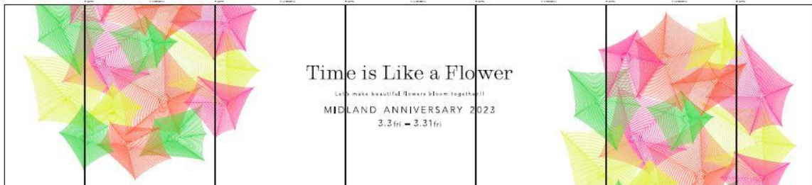
商業棟B1F アトリウムEV前ガラスシール

商業棟B1Fアトリウムや各所エントランスでは、ガラスシールでキャンペーンビジュアルを描きます。