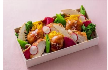
B1F ディーン&デルーカ

白魚と空豆のチーズベースPizza ¥1,850 (税込) ※3月1日～期間限定 (ディナーのみ)