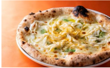
4F ピッツェリア イゾラ

オマール海老のガーリックバター煮込み 半身 ¥7,700 (税込) ※～3月31日期間限定 (4月以降はお問い合わせください) ※3日前までに要予約