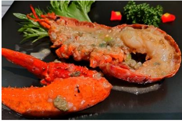
41F 中国飯店 麗穂