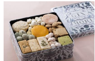
B1F パティスリー GIN NO MORI

最中種 (きな粉・ピンク・みどり) 各 ¥237 (税込) ※写真は調理のイメージです