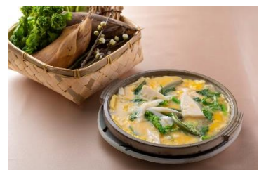
4F 尾張 三ぶん

季節の炊き込みご飯 コース料理 ¥8,000～の一品 単品 ¥3,500 (各税込) ※3月1日～5月31日期間限定