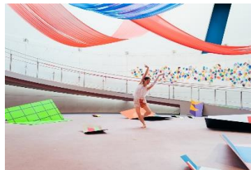
「SPREAD by SPREAD 明日は何色」 / Dance New Air 2020→21

L-E-V Sharon Eyal|GaiBehar に所属。公演活動と並行して、世界各地でワークショップ指導を行う。2012-2014年BatshevaEnsemble Dance Companyに所属。2011年韓国国際ダンスコンペティション金賞。2013年度香川県文化芸術新人賞。2014年Israel Jerusalem Dance Week Competition 受賞。第14回第15回日本ダンスフォーラム賞受賞。Gaga指導者。