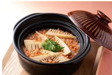
4F しゃぶしゃぶと焼肉 わにく

筍蒸し焼き 懐石料理フロア席 ¥36,300～/ 個室 ¥37,950～ (各税サ込) ※4月1日～4月30日期間限定 ※2日前までに要予約 ※写真はイメージです