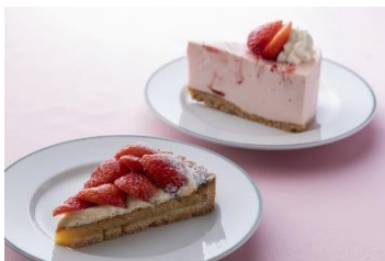
B1F ラスール オーバカナル

白魚と春野菜の卵とじ ¥1,320 (税込) ※3月1日～期間限定 (ディナーのみ)