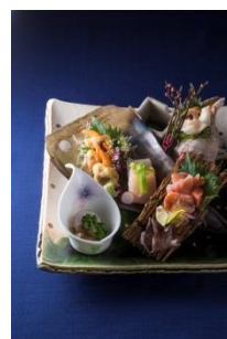
4F 築地寿司清 <11周年記念> 貝類盛り合せ 税抜 ￥3,500

愛知県食材を随所に取り入れた3つのコース。中でも1万500円のコースに注目を。目の前で取り分けて提供する豊橋産山吹き鶏のファルシは、ウズラの骨から取ったソースで仕上げました。3月1日～4月30日のディナータイム限定。 ※別途席料を頂戴いたします。