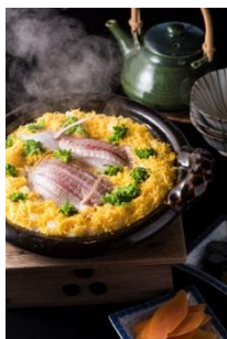
41F 京都吉兆 <11周年記念> 会席コース 税サ抜 ￥30,000

11周年を記念して、ミッドランドスクエア店だけの特別な期間限定メニューをご用意しました。 “旬”の愛知の食材を取り入れた春限定メニューをお楽しみください。