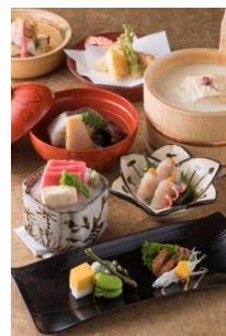
4F 松山閣 松山 <11周年記念> 11周年記念懐石 税サ込 ￥10,000 ￥12,000 ￥15,000

浅利の酒蒸し、鯛のダシ茶漬け風ひと口蕎麦、貝のお造りなど、三河湾の恵みをふんだんに盛り込みました。クレスンやルッコラなど、知る人ぞ知る愛知の有名野菜も一緒にお楽しみください。3月1日～3月31日のディナータイム限定。