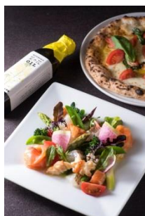
4F ピッツェリア イゾラ <11周年記念> オマール海老と知多野菜のサラダ仕立て 菜の花オイルの香りとともに 税込 ￥1,680 南知多産トマトと水牛モッツァレラのピッツァ 税込 ￥2,000

春は、三河湾の鯛がおいしくなる季節。コースのみにご用意する鯛と唐墨のご飯は、鯛の骨から取った出汁で炊き上げました。三河地方の菜の花と一宮市のこだわりの玉子を彩に添えて。3月1日～4月30日限定。