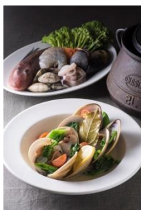
4F バル デ エスパーニャ ムイ <11周年記念> 知多野菜と地蛤の白ワイン蒸し 税込 ￥1,800 “サルスエラ”（魚介の煮込み） 税込 ￥4,000

三河湾の春食材といえば、豊富な貝類。生とり貝、タイラギ、青柳など旬の貝を5種類ほど盛り合わせにしました。すっきりとした地酒とともに、お刺身でお楽しみください。 春期限定。