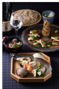
4F 紗羅餐（さらざん） <11周年記念> 愛知の食コース 税抜 ￥5,000 醸し人九平次 純米大吟醸 human グラス 税抜 ￥900

旨味が強く風味のある知多ハッピーポークの魅力と、中国伝統の調理で表現しました。中国醤油を使ったソースにも負けず、シンプルなのに奥深い味わいを楽しむことができます。3月1日～3月31日のディナータイム限定。