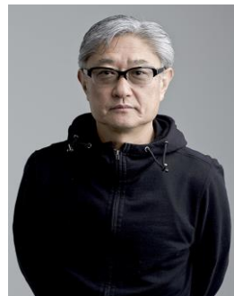
映画監督・ 映像作家 堤幸彦