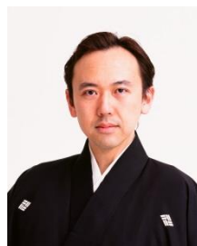
西川流四世家元 西川千雅

1981年生まれ。東京都出身。87年1月歌舞伎座「門出二人桃太郎」にて兄の桃太郎で二代目中村勘九郎を名乗り初舞台。12年2月新橋演舞場「土蜘蛛」僧智籌実は土蜘蛛の精、「春興鏡獅子」小姓弥生後に獅子の精などで六代目中村勘九郎を襲名。映画やドラマ等でも活躍し、2019年の大河ドラマ『いだてん いだてん〜東京オリムピック噺〜』では主演が決定している。