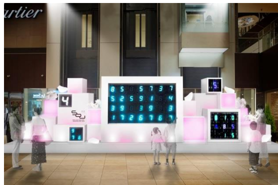
商業棟B1Fアトリウム ステージパネル イメージ