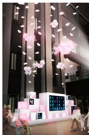
商業棟天井吊り イメージ