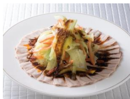
4F 南翔饅頭店 <11周年記念> 知多ハッピーポークを使用した薄切りゆで豚のガーリックソース 税抜 ￥1,500

菜花など知多半島で育った春野菜と、地蛤を組み合わせた春らしい一品。多種多様な豪華食材を煮込むスペイン料理“サルスエラ”は、三河湾バージョンでお届けいたします。～4月8日限定。※“サルスエラ”は2名様よりご注文ください。