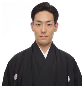
歌舞伎俳優 六代目 中村勘九郎

約400年前、今の名古屋市緑区有松町で始まった緻密で複雑な模様を作り出す有松鳴海絞り。その技法を受け継いだ竹田嘉兵衛商店は、創業以来さらに技を磨き、約100種類もの技法を生み出した。こうした職人の伝統技法により優れた和服を製作し、「竹田庄九郎」のブランド名で全国的に親しまれている。