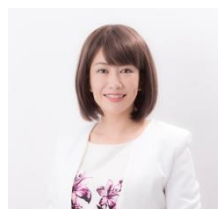
脳科学者・医学博士 ・認知科学者 中野信子

室町時代より20代500年に亘り香道を継承し続けてきた志野流の第20世家元蜂谷宗玄の嫡男。2002年より大徳寺530世住持泉田玉堂老大師の下に身を置き、2004年玉堂老大師より軒号「一枝軒」宗名「宗苾」を拝受、第21世家元継承者となる。現在は次期家元として全国教場及び海外教場等での教授、幼稚園から大学での講演を開催し世界各地で啓蒙活動を行っている。