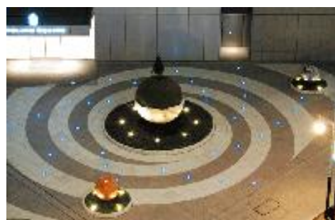
たほりつこ「30億年のゼロ」