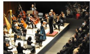
※5周年時写真