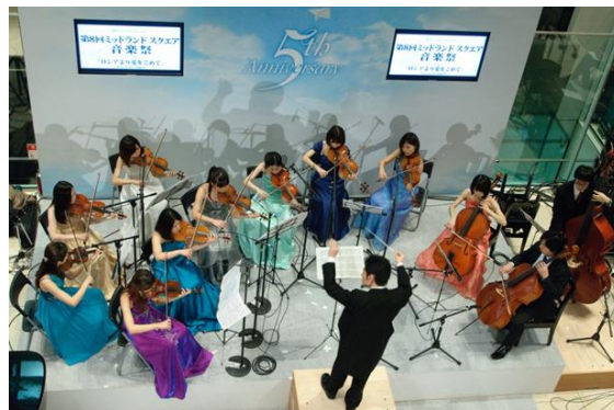
第8回ミッドランドスクエア音楽祭から

2008年より、春と秋の年2回開催しております「ミッドランドスクエア音楽祭」。 今回のテーマは「フランス音楽の魅力」。 歌劇「カルメン」などのクラシック音楽、シャンソン、フレンチポップス、ジャズ、アコーディオンなどフランス音楽の魅力を余すことなくお楽しみいただきます。