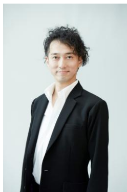
フラメンコダンサー 佐藤浩希

1998年に文化庁芸術祭新人賞を受賞。阿木燿子プロデュースの『FLAMENCO曾根崎心中』で文化庁芸術祭優秀賞を受賞し、2004年には「フェスティバル・デ・ヘレス」に海外から初参加して絶賛される。2006年にはNewsweek日本版の「世界が尊敬する日本人100人」に選出。2012年NHK大河ドラマ『平清盛』の白拍子役で話題に。2023年にはスペイン・ロハス劇場で公演を成功させ、舞踊批評家協会賞を受賞。唯一無二のフラメンコ舞踊手として国内外で評価されている。