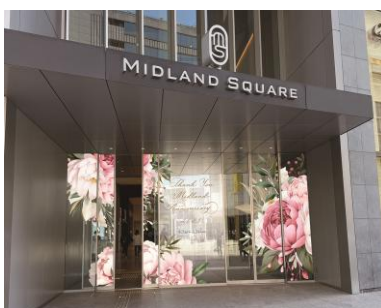
【商業棟】1F西エントランス