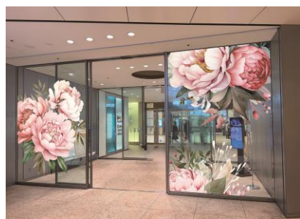
【商業棟】B1F西エントランス