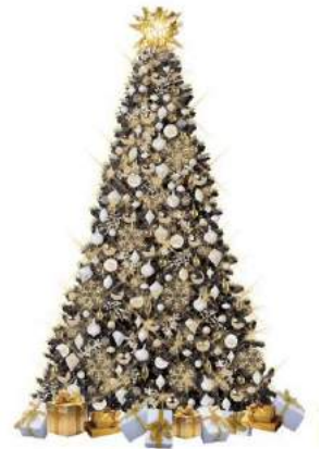
【オフィス棟1Fロビー】