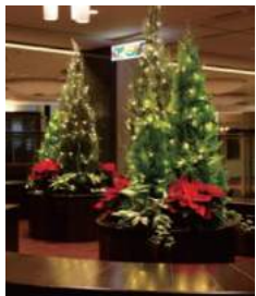
【商業棟4F 休憩スペース】