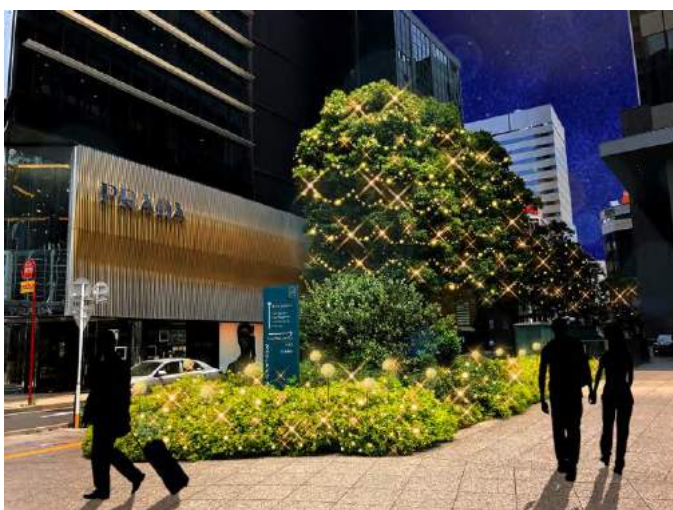
【ミッドランドスクエア北側】樹木11本／植栽 LED約26,500球＋ビーズinボール