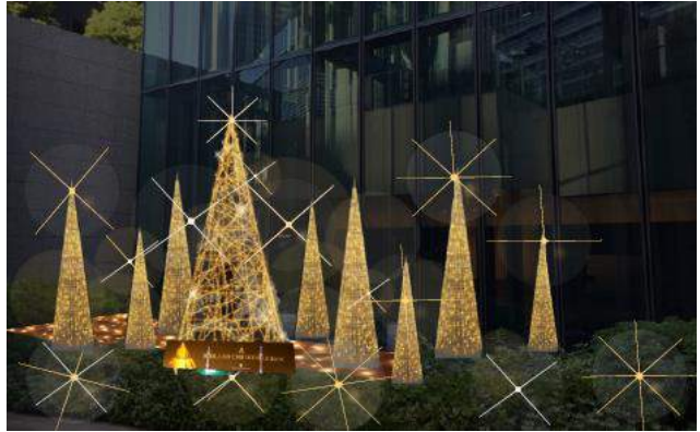
【ビル北側／オフィス棟B1FシャトルEV前】 LED約3,400球