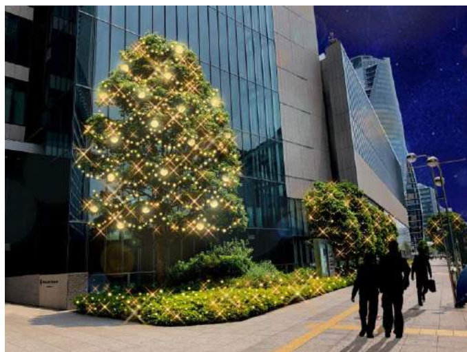
【ミッドランドスクエア西側】樹木9本／植栽 LED約40,300球＋ビーズinボール