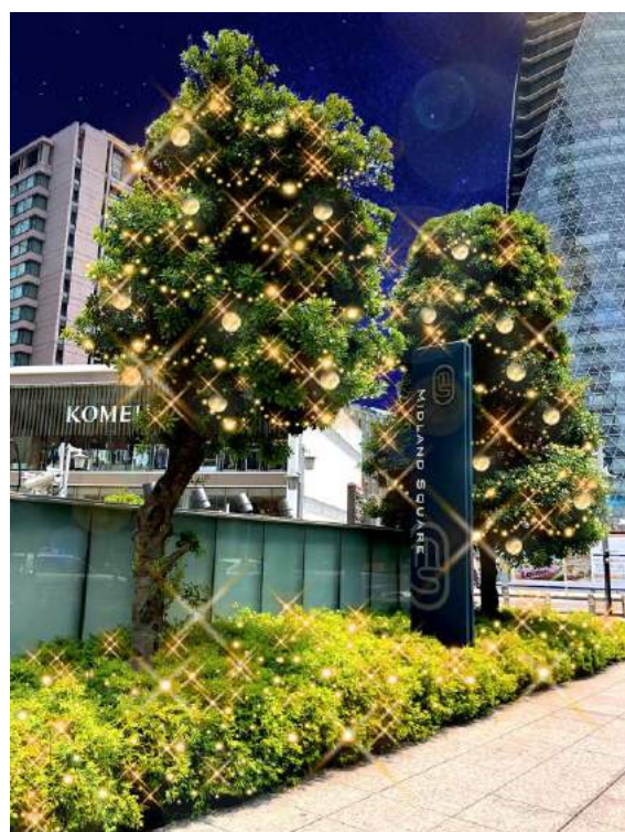
【ミッドランドスクエア南側&名駅通】 樹木11本／植栽 LED約19,500球＋ビーズinボール