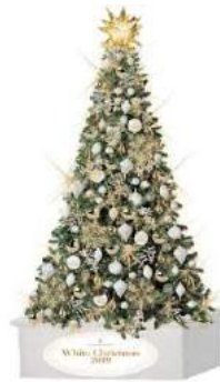
【オフィス棟44F スカイプロムナード】