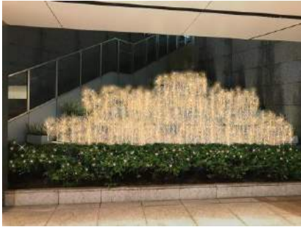
【ビル南側／商業棟B1F段々花壇】 LED約5,500球