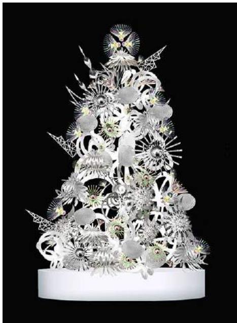
クリスマスツリー

アルミ、ネオプレン、パースボックスを使用した高さ約5mのアートツリー。1日数回、約3～5分程度、ファンタジックな音楽とともに、色とりどりに照明が変化します。（予定）