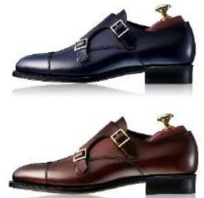
ミッドランドスクエア 店舗限定商品「源四郎」