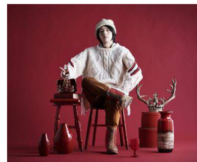
シンガーソングライター ビッケブランカ Vickeblanka

今年も名古屋駅エリアの商業施設が協力し、名駅通りを中心にウィンターイルミネーションを一齐点灯します。 ミッドランドスクエアではそのオープニングイベントとして、地元出身アーティスト、ビッケブランカを迎え、イルミネーションのスイッチオンを担当いただくと共に、バンド編成でのスペシャルライブを開催いたします。