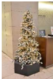
【商業棟 その他各所】