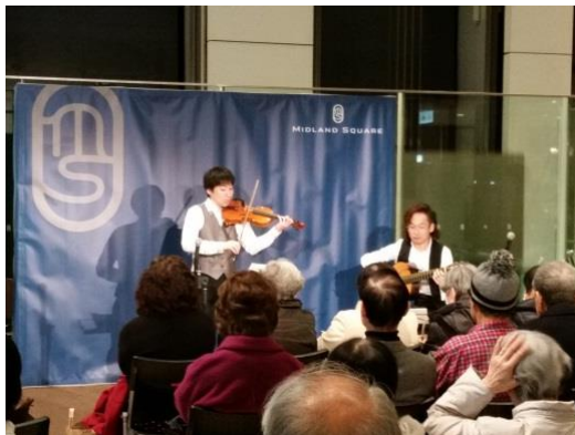
アトリウムコンサートの様子