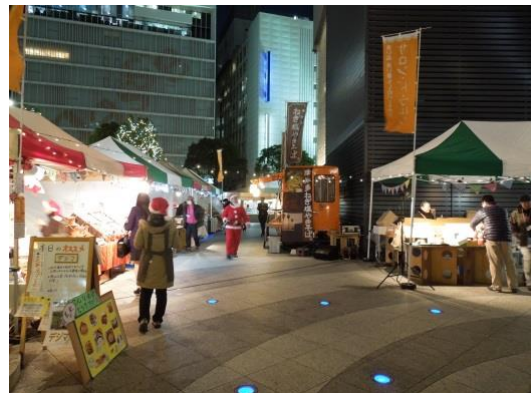
ミッドランド マルシェの様子