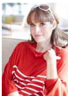
クレモンティーヌ

パリ生まれ。レコードコレクターの父親の影響でジャズに囲まれながら育つ。88年ソニーフランスよりデビュー。以来、ジャズ、ポップス、ボサノヴァなど様々なジャンルで数々の作品を発表。日本で最も愛されるフランス人歌手。今までのレコードセールスはトータル200万枚以上。2010年、「天才バカボン」フランス語カバーなどを収録したアルバム「アニメンティーヌ」を発表。アマゾン音楽総合ランキング1位獲得などの話題作となる。最新アルバムは、ディズニーなどファンタジー映画のメロディーで綴った「ドリーム・シネマ - リラクシング・スタンダード・コレクション-」。