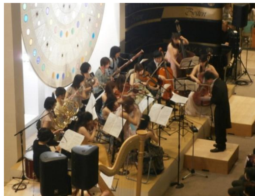
※第10回ミッドランドスクエア音楽祭の様子