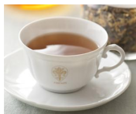
テ ポルタフォルトゥーナ

クローバーをブレンドした新作ハーブティー。 爽やかな香りのハーブをブレンドして飲みやすく仕上げました。 幸運を呼ぶハーブティーでハッピーに！ ※妊娠中の方、お子様はお控えください。