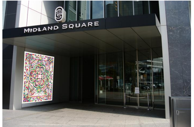
1Fエントランス装飾