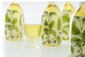
桑茶 桑茗(そうめい)

和久傳発祥の地、京丹後では良い桑の葉がとれることから縮緬産業が栄えました。そのお蚕さんも大好きな桑の葉を使い、生産者の方の思いを胸に桑の葉のお茶を作りました。ノンカフェインで、私たちの体にもとても良いと評判です。店頭では、3日間、鯖寿司と桑茶 桑茗1本の特別セット販売を実施。(数量限定)