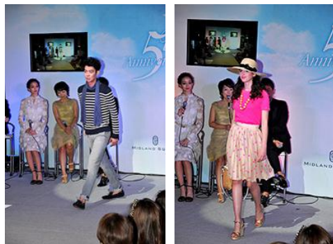
※過去のファッションショーの様子