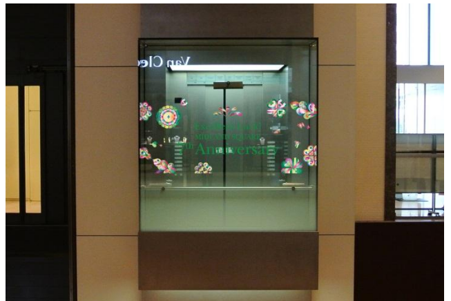
エレベーター装飾

カラフルで多幸感に溢れる世界観で、ペインティング、ドローイングの制作を中心に活動するアーティスト。ミュージシャンやファッションブランドとのコラボレーション、野外フェスティバルなどへのアートワークの提供など幅広い分野での作品展開を行う。また、表現手段はアニメーション、インスタレーションなど多岐に渡る。この秋、DU BOOKSより作品集をリリース予定。