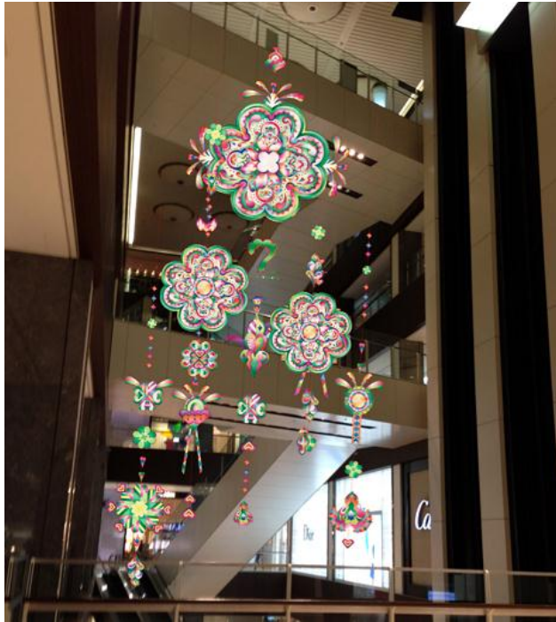
アトリウム天井吊り装飾(W5.4m×H10m)

アーティスト 金谷裕子氏監修の下、“ラッキークローバーカード”のビジュアルをベースとした館内装飾を展開。春らしく色鮮やかに、「幸運の祝祭」を盛り立てます。