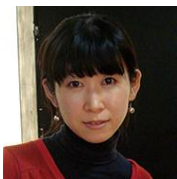
アーティスト 金谷裕子 Yuko Kanatani

カラフルで多幸感に溢れる世界観で、ペインティング、ドローイングの制作を中心に活動するアーティスト。ミュージシャンやファッションブランドとのコラボレーション、野外フェスティバルなどへのアートワークの提供など幅広い分野での作品展開を行う。また、表現手段はアニメーション、インスタレーションなど多岐に渡る。この秋、DU BOOKSより作品集をリリース予定。