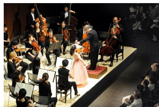
※昨年の様子