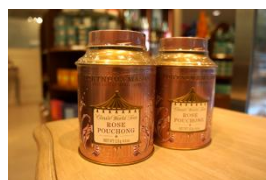
ローズプーチョン

中国の茶園で生産された発酵の若い中国紅茶に、バラの花びらを加えて作られた、香り高い紅茶です。