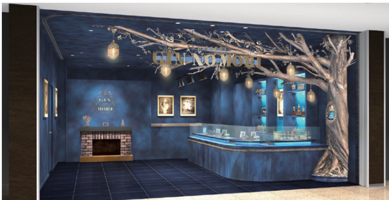
▲外観イメージパース

話題のクッキー缶『プティボワ』はお取り寄せサイトや公式通販では注文殺到中のため、1ヶ月以上(2022年5月現在)お届けにお時間をいただいている状況です。名古屋店では本店同様に数量限定にはなりますが毎日ご用意させていただきます。東海地区最大の都市である名古屋の店舗として、たくさんのお客様にパティスリー GIN NO MORI の魅力をお届けできるようさらに磨きをかけてまいります。