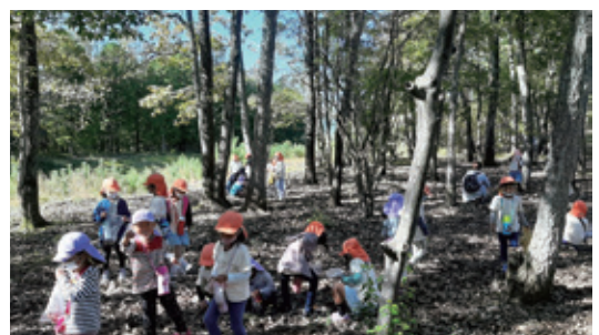
▲地域の子どもたちとのどんぐり拾いのようす