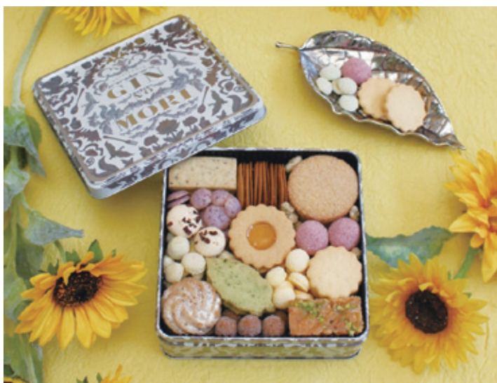
▲プチボワ 150 缶 summer 【2022 年版】