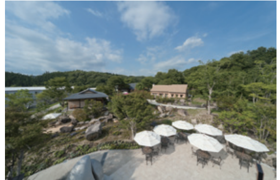
▲恵那銀の森鳥瞰図（オープン当時のもの）

私たちは昭和47年より続く冷凍おせちの製造メーカーです。BtoB向けのおせち販売で成長してきた当社ですが、直接お客様の「かお」を見ながらより多くのおいしいを届けていきたいと考え、2011年に岐阜県恵那市にある当時のおせち製造工場がある約66000㎡の広大な敷地内に四季折々の草木に囲まれた食と自然のテーマパーク『恵那 銀の森』をオープンしました。ひとつひとつ異なったテーマの施設で“食”を楽しんで頂くと共に、遊歩道散策など“自然”をゆっくりと楽しんで頂ける施設として多くの方にご来園いただいております。