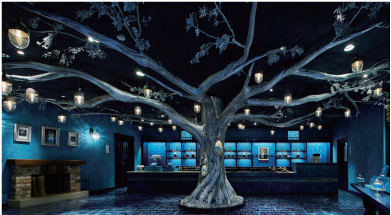
▲パティスリー GIN NO MORI 恵那本店 内観

『パティスリー GIN NO MORI』の本店は株式会社銀の森コーポレーション(本社:岐阜県恵那市/代表取締役社長:渡邊好作)が運営する岐阜県恵那市にある公園型施設『恵那銀の森』の中にあります。四季折々の美しい色彩、豊かな香りを放つ木々や草花。そして一粒として同じものがない木の実や果実たち。数えきれない命を育む森はどこまでも奥深く、魅力に溢れた場所です。森の素材をじっくり吟味し、自然そのままの美しさの無限の可能性を追及したい。私たちはそんな思いで、一つ一つ心を込めて丁寧に、お菓子を手作りしています。お店にはクッキー缶をはじめ、パウンドケーキやコンフィチュールなど、森の恵みをふんだんに使ったお菓子が並んでいます。ほんのひとつき、慌ただしい日常を忘れて自然の美味しさに癒されていただけのように、「森のおすそわけ」を用意してお待ちしています。