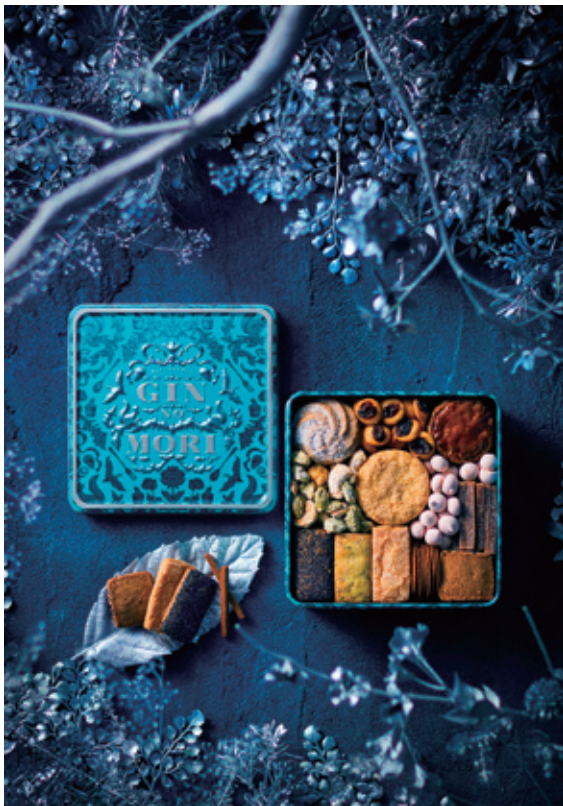
▲プチボワ 150 缶