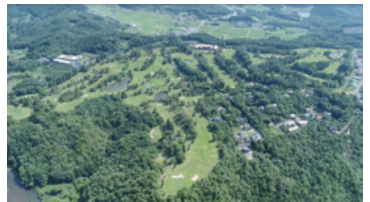
▲旧ゴルフ場跡地鳥瞰図

また、人と森をつなぐ入口になるための一環として始めたのが“森のおすそわけプロジェクト”。そのプロジェクト第一弾が『パティスリー GIN NO MORI』となります。恵那の自然の中でだからこそ作ることができる、森の食材を使用したお菓子から森の尊さや重要性、そして我々の行っている活動について知ってもらおうきっかけになればと考えております。