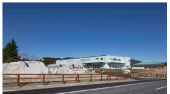
▲2022年2月設立の新工場