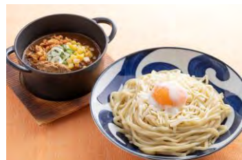
4F フジヤマ55 ミッドランドラーメンスタンド

桜舞（おうぶ） ¥1,800（税込） 泡桜 ¥1,600（税込） ※桜の時期の期間限定 ※ディナータイムは別途席料 ¥1,000 を頂戴いたします