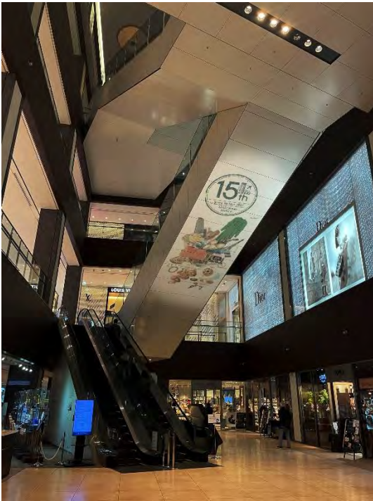
商業棟B1F・エスカレーター裏 プロジェクターで動画を投影