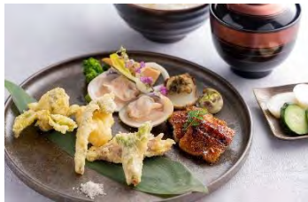
4F うなぎ四代目菊川

<15周年記念> 15周年特別懐石 フロア席ペア ¥121,000／ 個室ペア ¥139,150（各税サ込） ※3月1日～3月31日期間限定 ※2日前までに要予約 ※写真はコースのイメージです ※3名様以降はおひとり様＋¥55,000～にて承ります