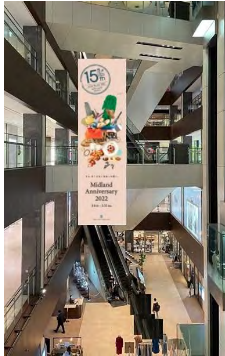
商業棟B1F～4F吹き抜け 天井吊りバナー