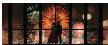
スカイプロムナード島