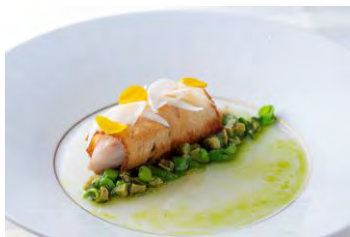
42F エノテカ ピンキオーリ

トスカーナパンを巻いて焼き上げた北海道産キンキ ツブ貝と豆類のインティンゴロ コース料理 ¥19,800～（税込） の一品 ※別途サービス料10%を頂戴いたします ※～5月31日期間限定 ※ランチコースやアラカルトでもご注文いただけます