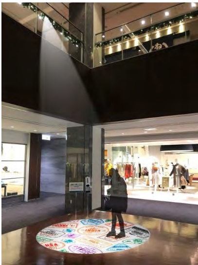
商業棟3Fエスカレーター付近足下 プロジェクター動画投影