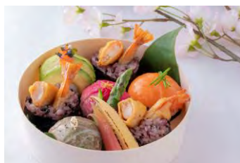
B1F ディーン＆デルーカ

国産筍 醤油焼き ¥2,300（税込） ※価格は仕入れ状況により変動あり ※筍が入荷する時期限定（ディナーのみ）