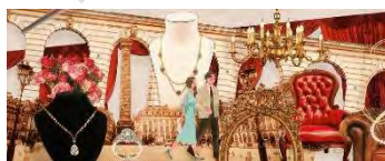
ラグジュアリー島