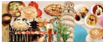
レストラン・カフェ島