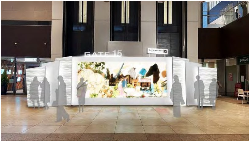
商業棟B1Fアトリウム 搭乗ゲート風モニター

搭乗ゲートを模したモニターが登場！ 旅が恋しいあなたに♪ポップなCGイラスト映像で、 ミッドランドスクエアの世界感へのご案内いたします。