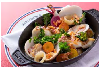
4F ビストロイナシュヴェ

トスカーナパンを巻いて焼き上げた北海道産キンキ ツブ貝と豆類のインティンゴロ コース料理 ¥19,800～（税込） の一品 ※別途サービス料10%を頂戴いたします ※～5月31日期間限定 ※ランチコースやアラカルトでもご注文いただけます