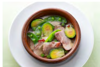
4F バル デ エスパリーニャ ムイ

<15周年記念> 桜鯛と桜海老のブイヤベース仕立て 春の香り ¥2,700（税込） ※3月～期間限定 ※コースでもご注文いただけます（＋¥1,500） ※写真は2名様分です