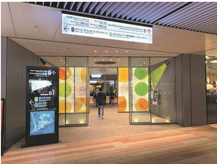
【商業棟】B1Fピエールマルコリーニ横風除室