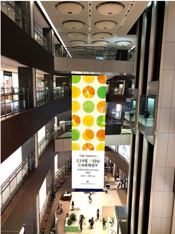
【商業棟】1F吹き抜け天井吊り

ビタミンカラーを使ったビジュアルで、色鮮やかに。 ポップなデザインで元気をお届けします！