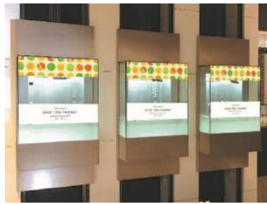
【商業棟】E V ガラスシール