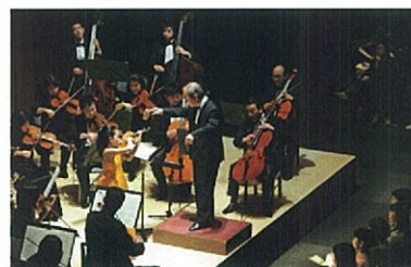
※3周年実施写真